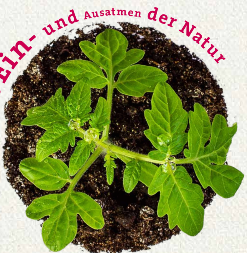
Das Ein- und Ausatmen der Natur

Die Hauptvegetationszeit, die etwa von April bis Oktober andauert, ist die Phase im Jahr, in der die Hauptmasse der Pflanzen in einer Region gedeihen. Sie wechseln sich mit der Ruhephase im Jahresverlauf ab und beide sind gleichermaßen essentiell für ein gesundes Pflanzenwachstum. Im Jahr 2018 betrug die Vegetationsperiode 225 Tage.